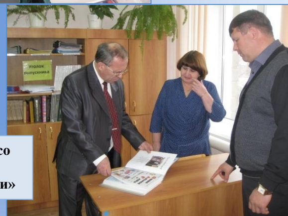
Знакомство со школьной газетой «Шаги»