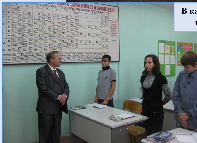
В кабинете химии идет беседа