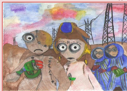
К. Купорез - 10 класс