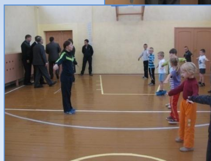
В новом спортзале школьники показали гостям разминку