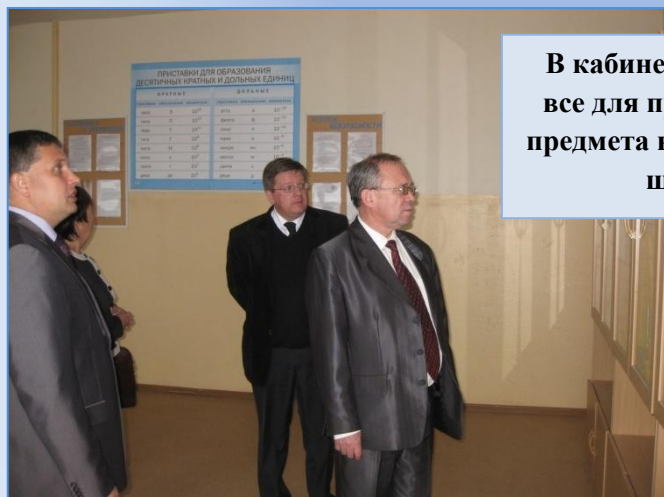
В кабинете физики - все для преподавания предмета в современной школе