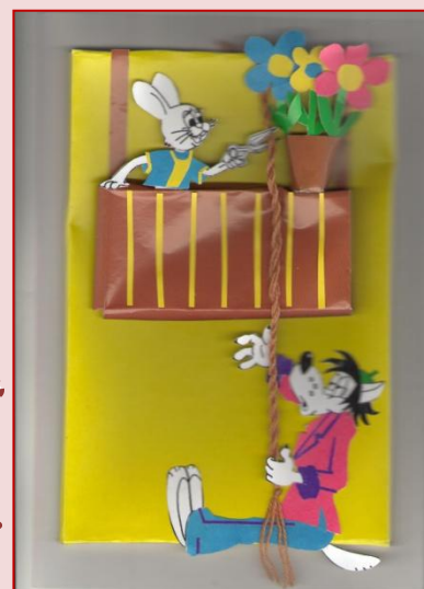
А.Кузнецов – 2 класс