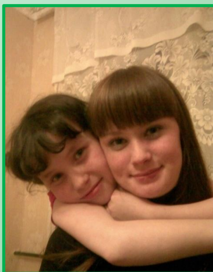
На фото: Я и моя сестра

Бабушки часто мне рассказывают о своем послевоенном детстве, а когда у нас в школе проходил классный час «Дети войны», я приносила фотографии родственников и рассказывала о них. Это были трудные времена. Каждый год 9 Мая мы ходим всей семьей к Обелиску Славы в нашем селе, возлагаем цветы у памятника погибшим односельчанам.