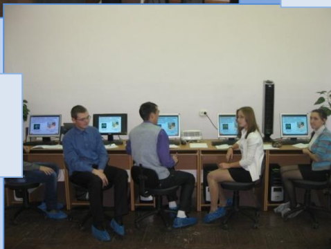
Идет беседа с выпускниками 9а класса