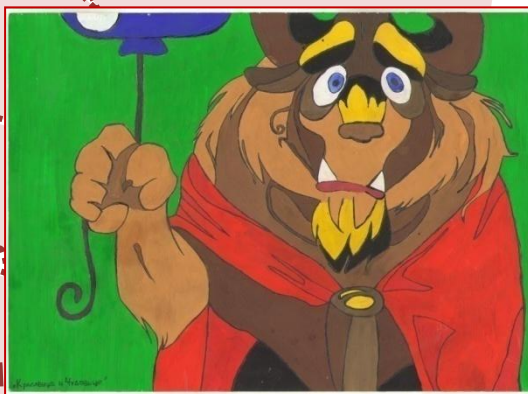
Д. Купорез - 10 класс